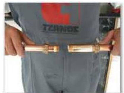
• Εφαρμογή CONEX